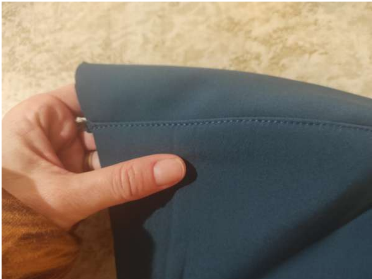
23. Detail prošití z lícu, rovnostehem.