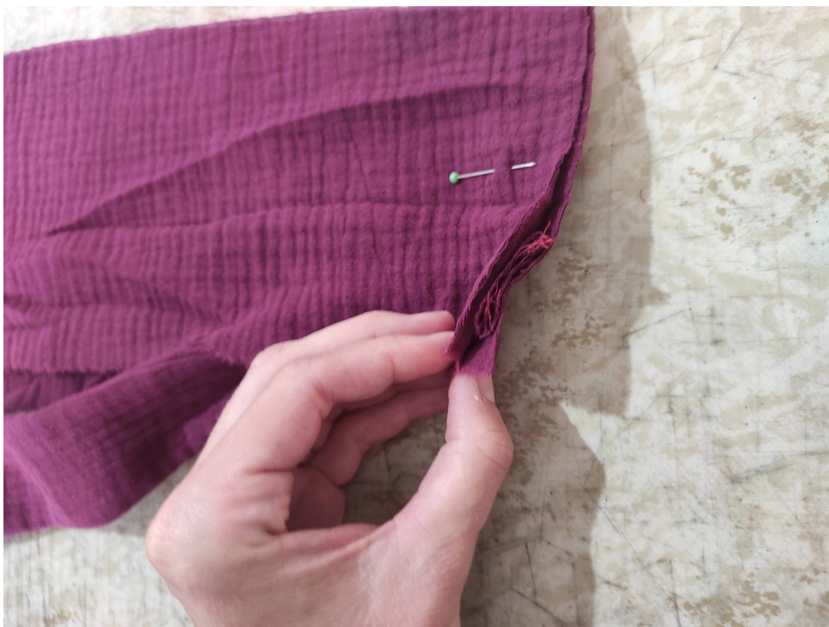
33. Detailní pohled vložení vazačky mezi pásy PD a ZD.