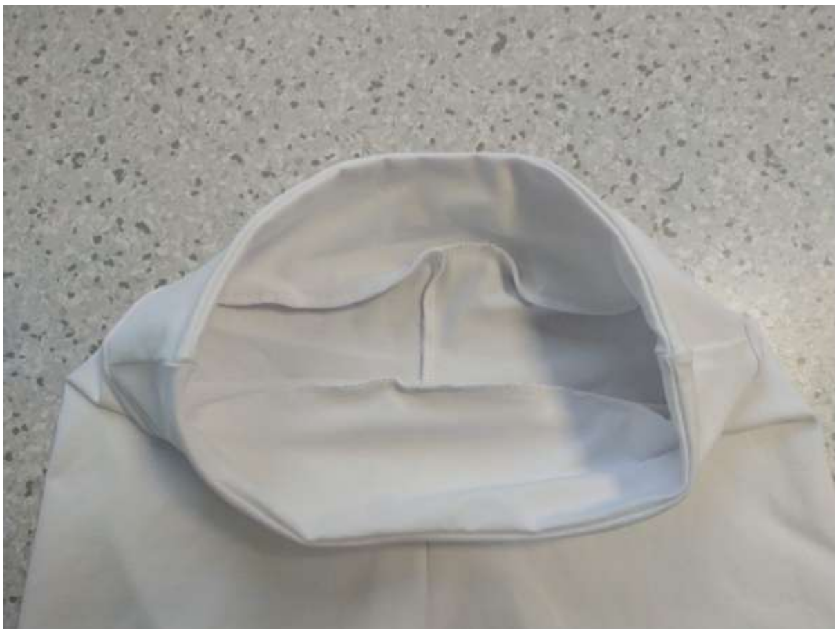
19. Pohled na vnitřní švy.