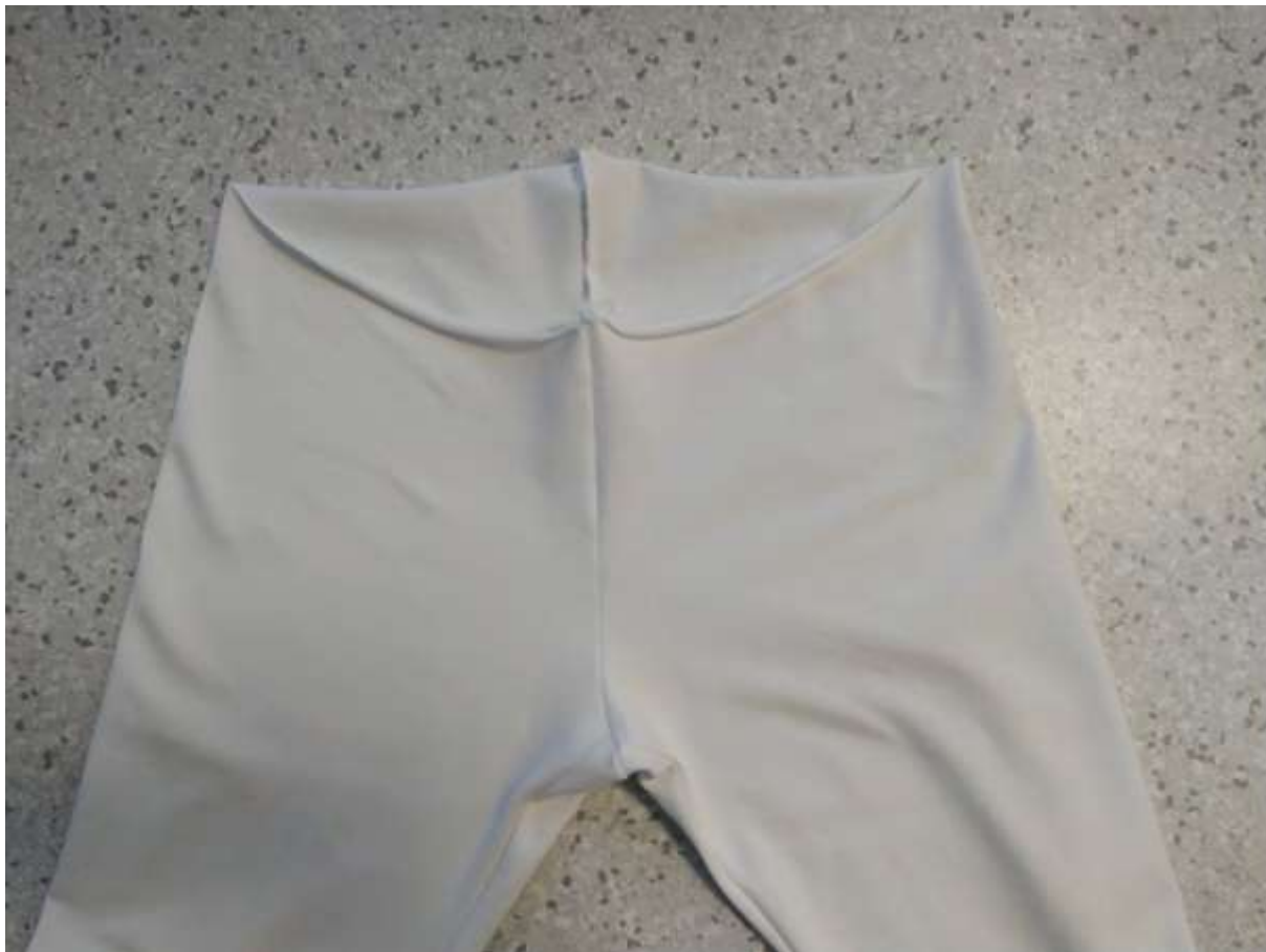
6. Pohled na sešité nohavice.